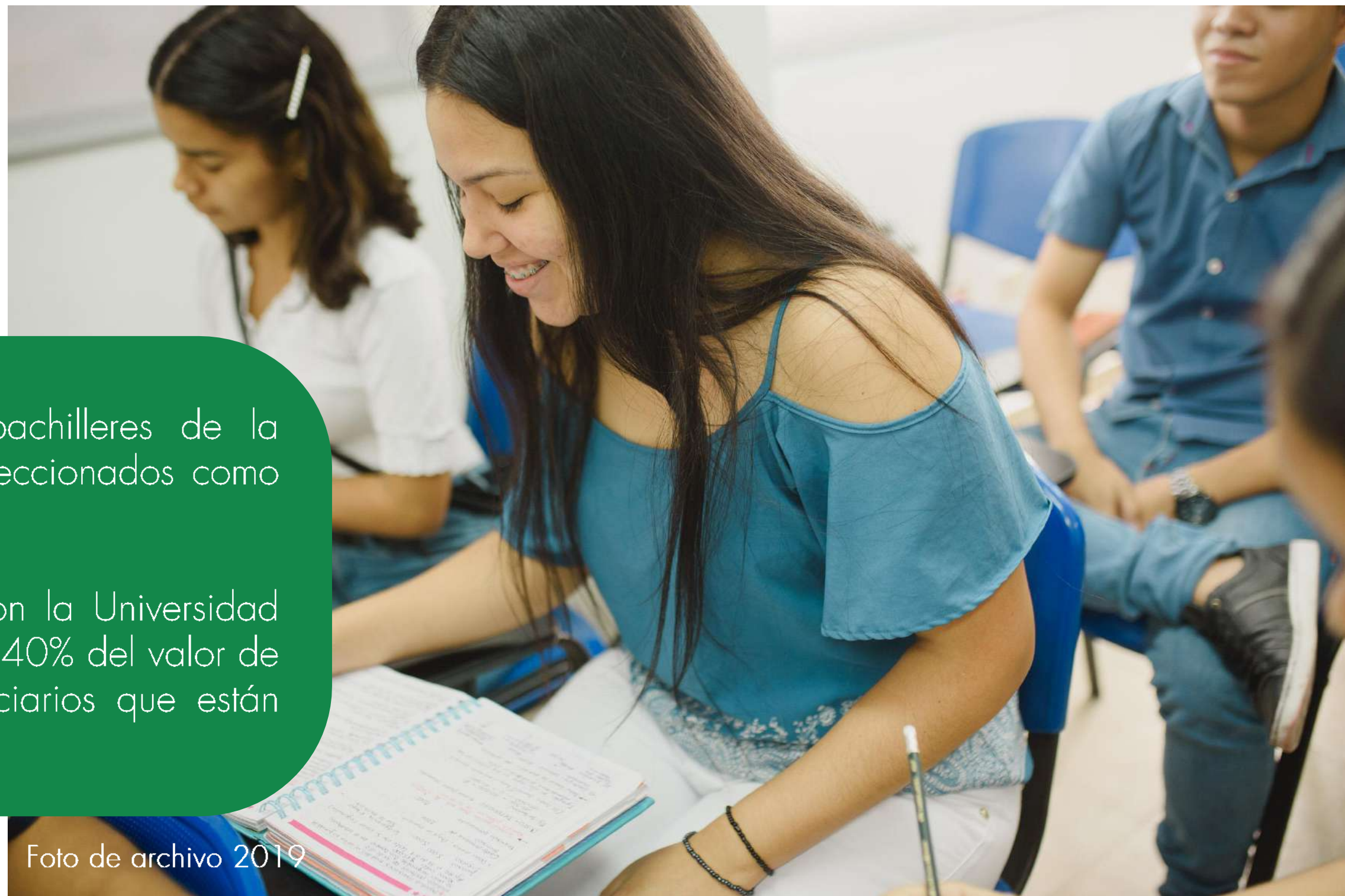
Foto de archivo 2019

Se logró firmar un convenio educativo con la Universidad Autónoma del Caribe, en el que aporta el 40% del valor de la matrícula académica de los 7 beneficiarios que están estudiando en esa institución